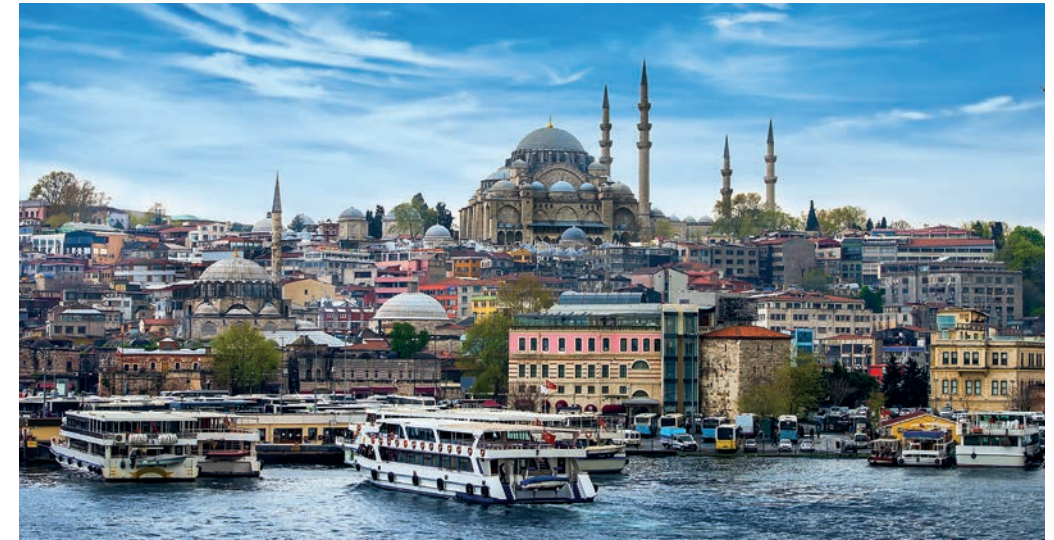
Istanbul Thổ Nhĩ Kỳ